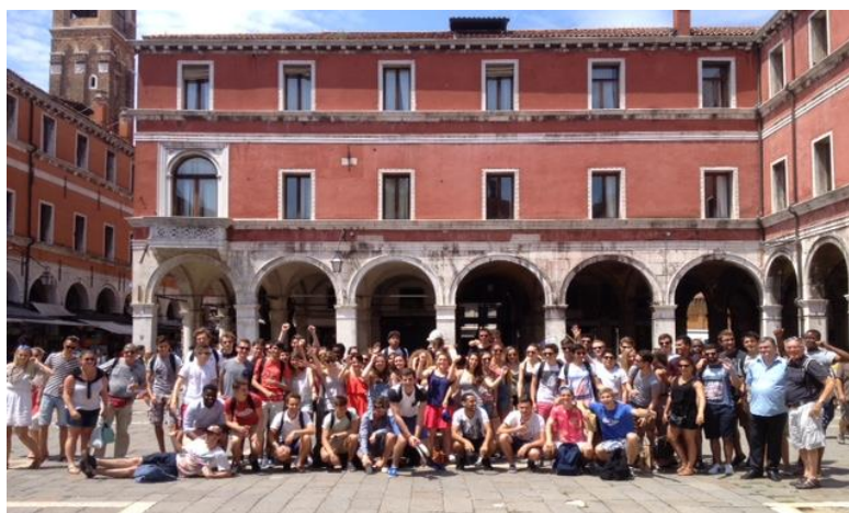
Venise : promotion 2014-16